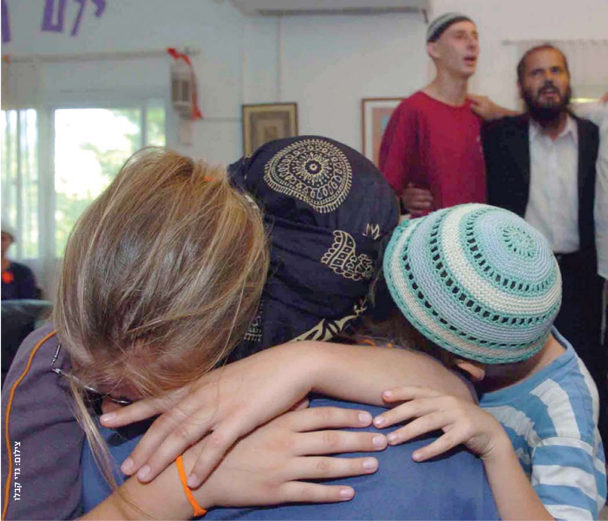
צילום: גדי קבילי